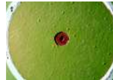
Füllstoff: Quarzfeinstmehl* Filler: Silica flour*

Weathering resistant outdoor applications are long since standard purposes for surface treated silica flour (SILBOND® W 12 EST) due to the outstanding mechanical and chemical processibility into the epoxy polymere systems. SILBOND® silica flour is nowadays increasingly applied also in indoors casting resin parts, as for products with high glossy, top-quality surfaces.