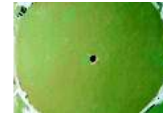
Füllstoff: Silanisiertes Quarzfeinstmehl* Filler: Silane treated silica flour*

„Oberflächenmodifizierte Füllstoffe für jede Wetterlage“ “surface treated fillers for every meteorological condition”